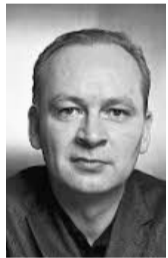
Ferdinand von Schirach

Was nicht heißen soll, dass der Strafverteidiger nun ein von Grund auf schlechtes Buch vorgelegt hat. Vor allem die erste Story im Band, „Volksfest“, gefällt, weil darin offensichtlich sehr viel autobiographisches eingeflossen ist. Ein Konsortium von Anwälten befasst sich in einer Kleinstadt mit einer scheußlichen Tat: Eine Gruppe von Honoratioren hat eine 17-jährige Kellnerin viehisch vergewaltigt; die Täter sind nicht zu