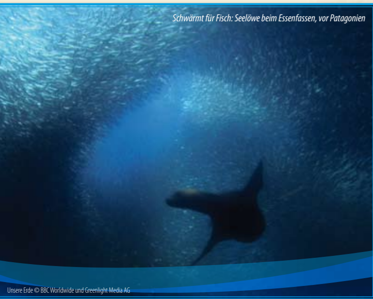
Schwärmt für Fisch: Seelöwe beim Essenfassen, vor Patagonien

Beispiele: Ich suche einen Teich, nicht zu warm und nicht zu kalt, mit vielen Insekten, weit weg von einer Straße ... (Frosch). Angebot Reisebüro: heimische Naturschutzgebiete || Ich suche eine eiskalte Landschaft im Norden, direkt am Meer, ruhig gelegen, mit leckeren Robben in der Nähe (Eisbär); Angebot: Sibirien, Alaska, Kanada, Grönland.