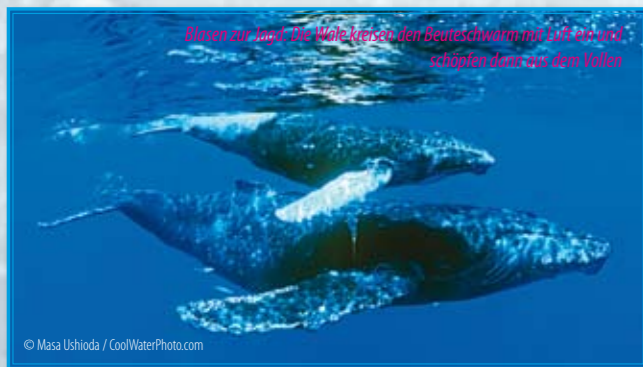
Strom zur Rück: Die Wale küssen den Beuteschwarm mit Luft und schäpfen dann aus dem Vollen

Heute sind Afrikanische Elefanten zumindest offiziell geschützt, ihre Populationen stabil. Dennoch stehen sie auf der Roten Liste der Weltnaturschutzunion (IUCN), denn sie sind gefährdet durch Wilderei und durch den Wassermangel, den der Klimawandel weiter verschärft.