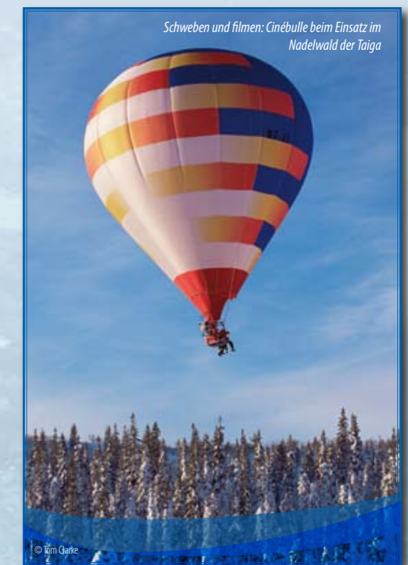
Schweben und filmen: Cinébulle beim Einsatz im Nadelwald der Taiga

Regisseur Fothergill, von Hause aus Zoologe, hatte sich bereits für DEEP BLUE anspruchsvollste (Unterwasser-) Technik zunutze gemacht. UNSERE ERDE dringt filmisch in sämtliche Teile der Biosphäre vor. Diese Produktion lässt hochentwickelte Dokumentartechnik auf Naturphänomene und Lebewesen treffen, von denen einige bereits im Verschwinden begriffen sind. Der beispiellose dokumentarische Aufwand eröffnet Blicke auf Tiere und Landschaften, die anders nicht realisierbar gewesen wären. Und die selbst eine entwickeltere Technik der Zukunft möglicherweise nicht mehr zeigen kann – wenn bis dahin entscheidende Akteure verschwunden sind.