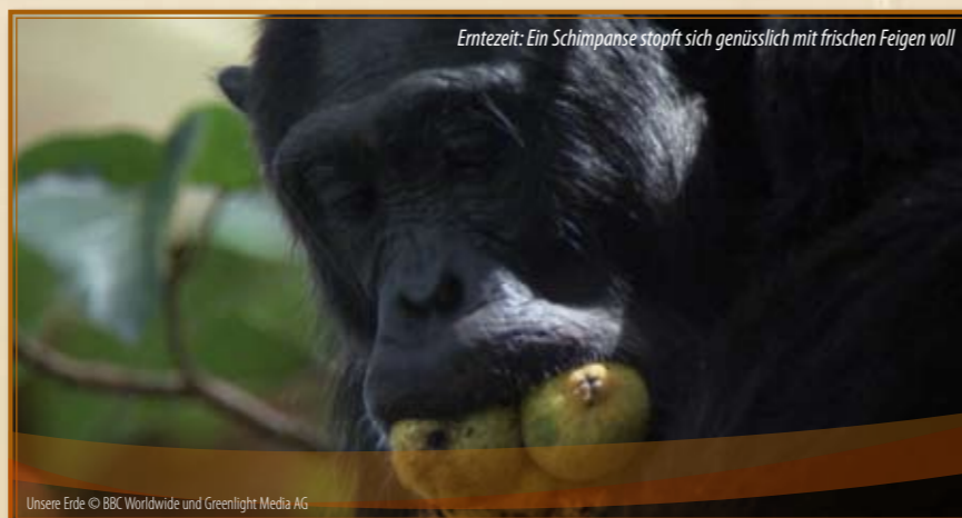
Erntezeit: Ein Schimpanse stopft sich genüsslich mit frischen Feigen voll