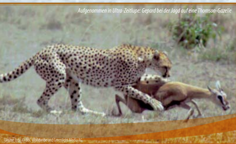
Aufgenommen in Ultra-Zeitlupe: Gepard bei der Jagd auf eine Thomson-Gazelle

Für besonders dramatische Einstellungen kamen digitale Hochgeschwindigkeitskameras zum Einsatz, die bis zu 2.000 Bilder pro Sekunde aufzeichnen, bei voller Auflösung. Auch in starker Zeitlupe garantiert das noch gestochen scharfe Bilder: im Extremfall ließen sich vier Sekunden Aufnahme als Fünf-Minuten-Film zeigen.