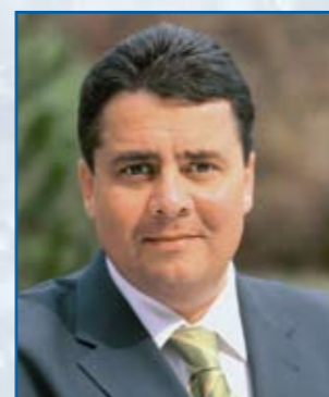
Sigmar Gabriel Bundesminister für Umwelt, Naturschutz und Reaktorsicherheit

Daher bitte ich Sie um Ihre Unterstützung. Sollen sich auch zukünftige Generationen noch über den Reichtum der Natur freuen und ihn nutzen können, dann gilt es auch Schülerinnen und Schülern zu zeigen: Der Verlust der biologischen Vielfalt betrifft uns alle, und wir sind gemeinsam verantwortlich.