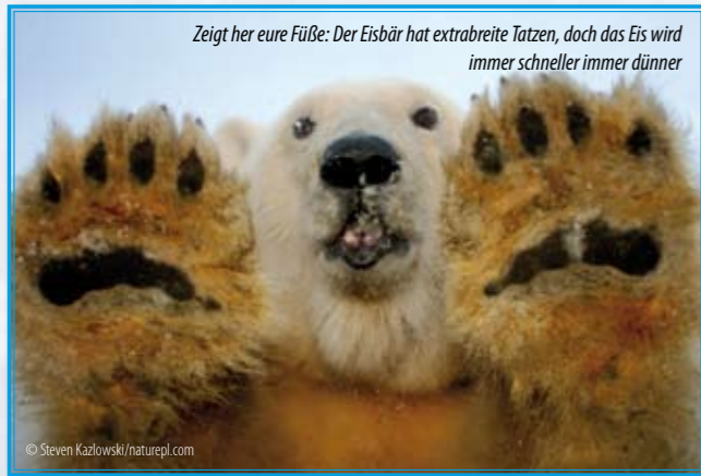
Zeigt her eure Füße: Der Eisbär hat extrabreite Tatzen, doch das Eis wird immer schneller immer dünner