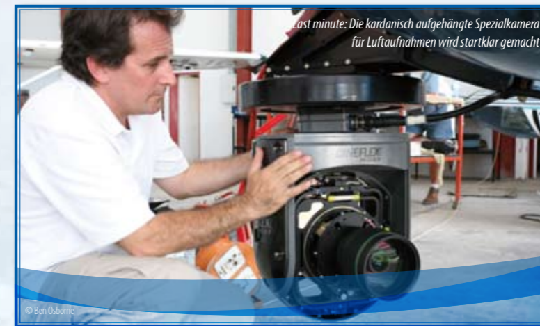
Last minute: Die kardanisch aufgehängte Spezialkamera für Luftaufnahmen wird startklar gemacht

Für zahlreiche Aufnahmen verwendete man einen Hubschrauber als fliegenden „Kamerakran“. Entscheidend war die neuartige Kameraaufhängung vorn unter der Kabine (Heligimbal Technology). Die Kamera ist kardanisch gelagert und dadurch dreidimensional frei drehbar. Das kreiselstabilisierte System schirmt außerdem die unvermeidlichen Vibrationen des Hubschraubers ab, die bei normalen Aufnahmen zum Verwackeln führen. Der Kameramann steuert die Aufnahme vom Co-Piloten-Sitz aus mit Bildschirm und Joystick. Deutlich wird die Funktionsweise beim Überflug des Wasserfalls mit kombiniertem Horizontal- und Vertikalschwenk: Eine derart präzise geführte, ungeschnittene, stabile Aufnahme ist mit keiner anderen Technik denkbar. Besser noch, die Stabilität der Aufhängung erlaubt es, starke Teleobjektive zu verwenden und Tiere aus großer Entfernung heranzuzoomen. Dennoch, auch diese Technik hat ihre Grenzen, die schlicht durch das Fluggerät vorgegeben sind.