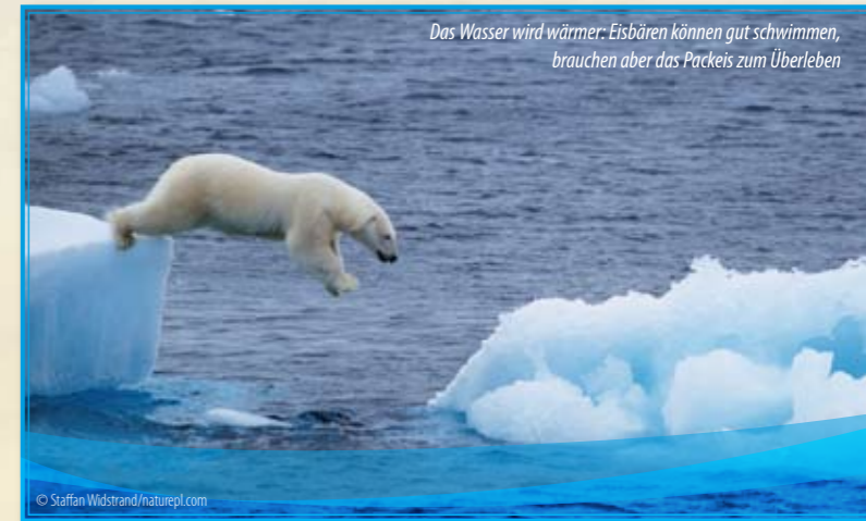
Das Wasser wird wärmer: Eisbären können gut schwimmen, brauchen aber das Packeis zum Überleben

Wie stellst du dir den Ideallort vor, an dem Menschen die Natur achten? Zeichne deine Wunschvorstellung auf und stelle diese mit deinen Mitschülern zu einem Bild zusammen.