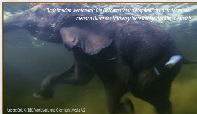
Badefreuden werden rar: Die Elefanten leiden empfindlich unter der zunehmenden Dürre der Trockengebiete infolge des Klimawandels

Weltweit gibt es noch etwas mehr als 20.000 Eisbären. Sie sind gefährdet durch eine direkte Folge des Klimawandels: Das Packeis schmilzt im Frühjahr immer schneller, und oft können die Eisbären den Robben nicht mehr folgen – nach der kräftezehrenden Hungerpause durch Winterschlaf ist das eine fatale Situation.