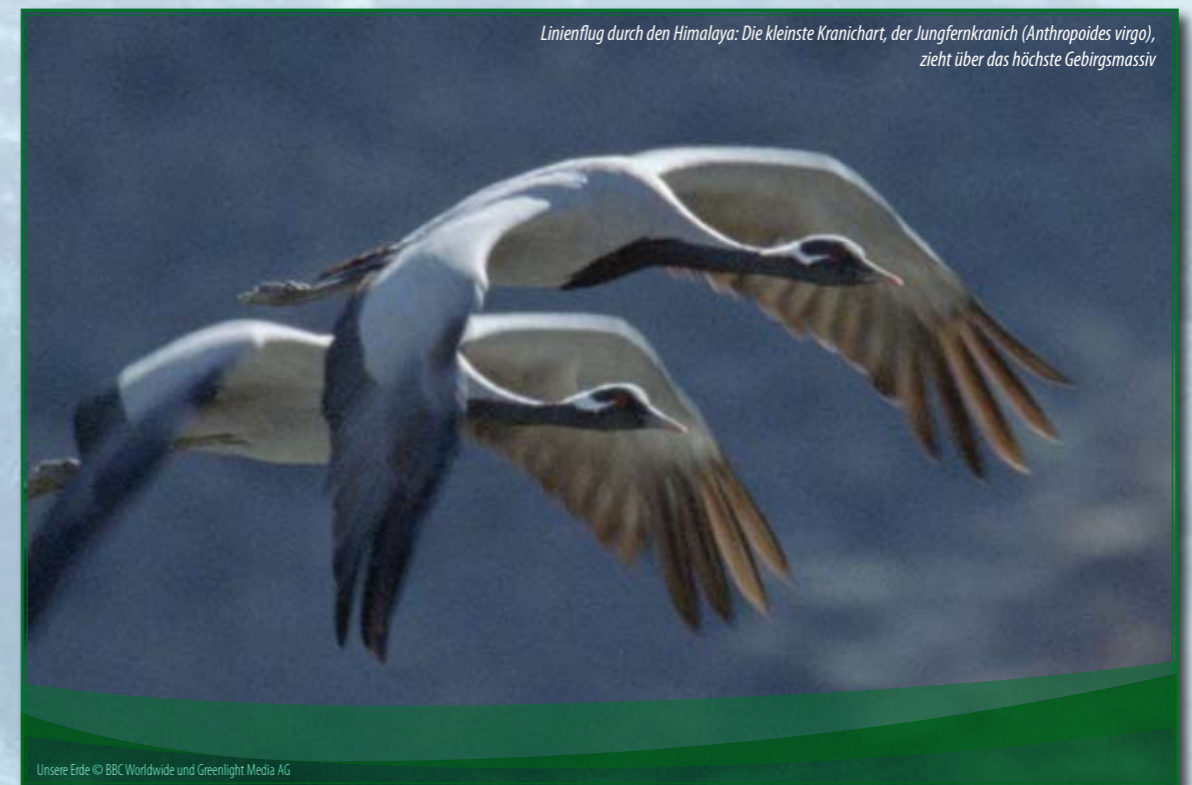
Linienflug durch den Himalaya: Die kleinste Kranichart, der Jungfernkranich ( Anthropoides virgo ), zieht über das höchste Gebirgsmassiv

Das klare Ziel wäre eine globale Politik und Wirtschaft der Nachhaltigkeit. Wir dürften der Natur nicht mehr als das entnehmen, was auf natürliche Weise nachwächst. In dieser Hinsicht beginnt Artenschutz bei ganz alltäglichen Entscheidungen und ist eine Aufgabe für jeden von uns. Welche Leistungen vermag Homo sapiens zu vollbringen? An Tipps und Anleitungen mangelt es bekanntermaßen nicht.