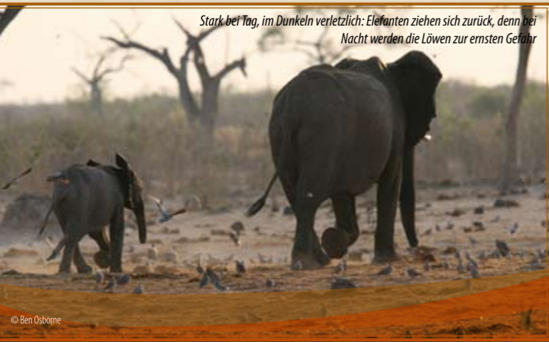
Stark bei Tag, im Dunkeln verletzlich: Elefanten ziehen sich zurück, denn bei Nacht werden die Löwen zur ernstesten Gefahr

Wer genau hinschaut, „sieht“ eine Figur, ein Gesicht oder eine magische Linie, Schatten und Lichtreflexe. Das versucht man so genau wie möglich als Bleistiftzeichnung festzuhalten, die Zeichnungen werden gemeinsam betrachtet. Wer ein Fotohandy hat, unterstützt seine visuelle Erinnerung durch Schnappschüsse (zusätzlich zur Zeichnung nach dem Original).