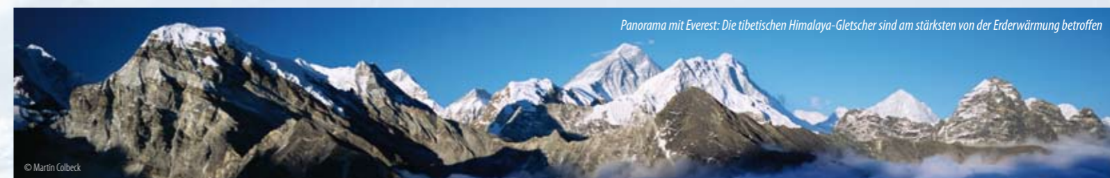
Panorama mit Everest: Die tibetischen Himalaya-Gletscher sind am stärksten von der Erderwärmung betroffen