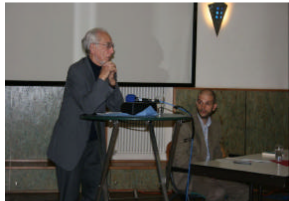
Erhard Eppler in Dortmund

Für mich war es eine große Freude, dass der 80-jährige Vordenker der SPD und ehemalige Bundesminister Erhard Eppler am 6. September 2007 zu mir nach Dortmund kam (siehe dazu auch Seite 2). Angesichts einer breiten gesellschaftlichen Debatte über die Aufgaben und die Handlungsfähigkeit unseres Staates, empfand ich sein Buch: „Auslaufmodell Staat?“, als passende Gelegenheit mit ihm über das Thema zu diskutieren. Etwa 50 Personen lauschten seinem freigehaltenen Vortrag und stellten sich einer kontroversen Diskussion. Erhard Eppler machte deutlich, dass ein handlungsfähiger Staat notwendig ist, um das Gemeinwohl zu sichern sowie eine solidarische und gerechte Gesellschaft zu gestalten.