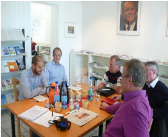
Im Gespräch mit Gewerkschaftsvertretern

Das aktive Gespräch mit gesellschaftlichen Organisationen und Gruppen in Dortmund zu suchen, ist mir ein besonderes Anliegen. So besuchte ich beispielsweise die streikenden Mitarbeiter der Telekom, sprach mit Vertretern verschiedener Gewerkschaften, mit Amnesty International und mit einigen Unternehmen.